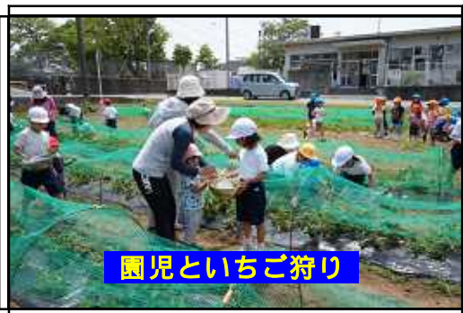
園児といちご狩り

次は、ほくぶ保育園との「つながり」です。園児があいさつマンデーに参加して下さっていることは既にご承知のことと思いますが、1年生が年長のきりん組の時にまちづくり協議会の協力を得て育ててきたイチゴがたわわに実り、甘くて真っ赤なイチゴがどっさりと届き、全校で美味しくご相伴にあずかりました。また、イチゴ狩りにもお邪魔しました。また、今週は図書委員が読み聞かせに伺いました。来月からは、園児のみなさんが学校の図書館に絵本を借りに来てくださいます。ここでも「つながり」が深まってきています。